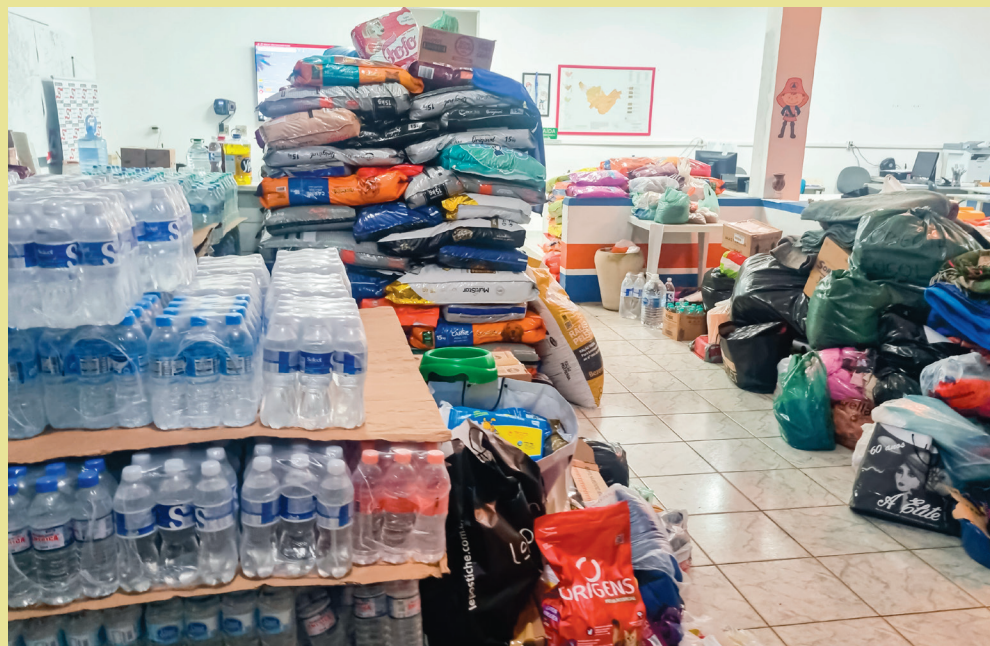
Doações concentradas na sede da Defesa Civil

Após comunicado da Defesa Civil, que encerrou no dia 15 o recebimento de doações para as vítimas das chuvas no Rio Grande do Sul, a Câmara de Taubaté deixará de recepcionar os donativos que estavam sendo entregues pela população.